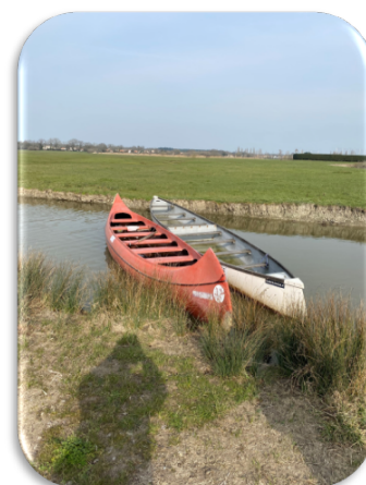
@canobus mis à disposition des cycles 2 et 3